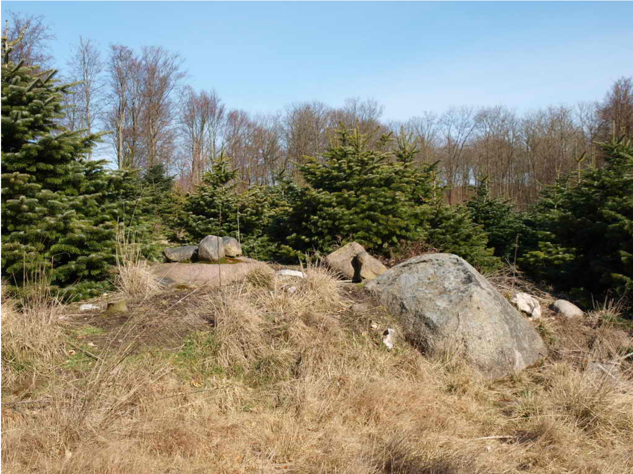
Rest ad dysse fra stenalderen (3.500 f. Kr.). Den ligger på en bakketop i pyntegrøntplantage. Den ligger lidt vest for den nord-syd gående skovvej.